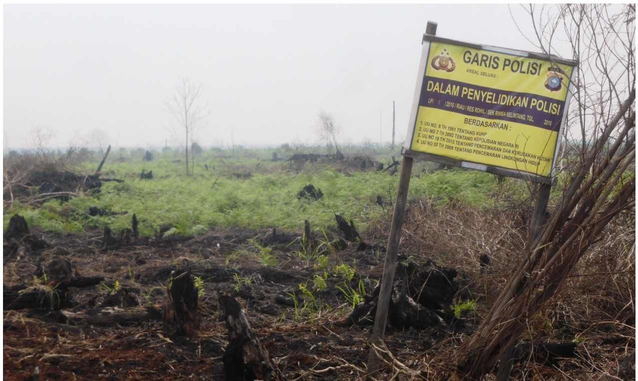
Gambar 5 dan 6. Pemasangan garis polisi yang menunjukkan proses hukum terhadap pembakaran hutan dan lahan di PT Ruas Utama Jaya tengah dilaksanakan. Gambar diambil pada titik koordinat N1°48'49.55" E101°4'59.69" (gambar 5) N1°48'29.49" E101°4'36.90" (gambar 6). Gambar diambil pada tanggal 30 Agustus 2015. Eyes on the Forest 2015.