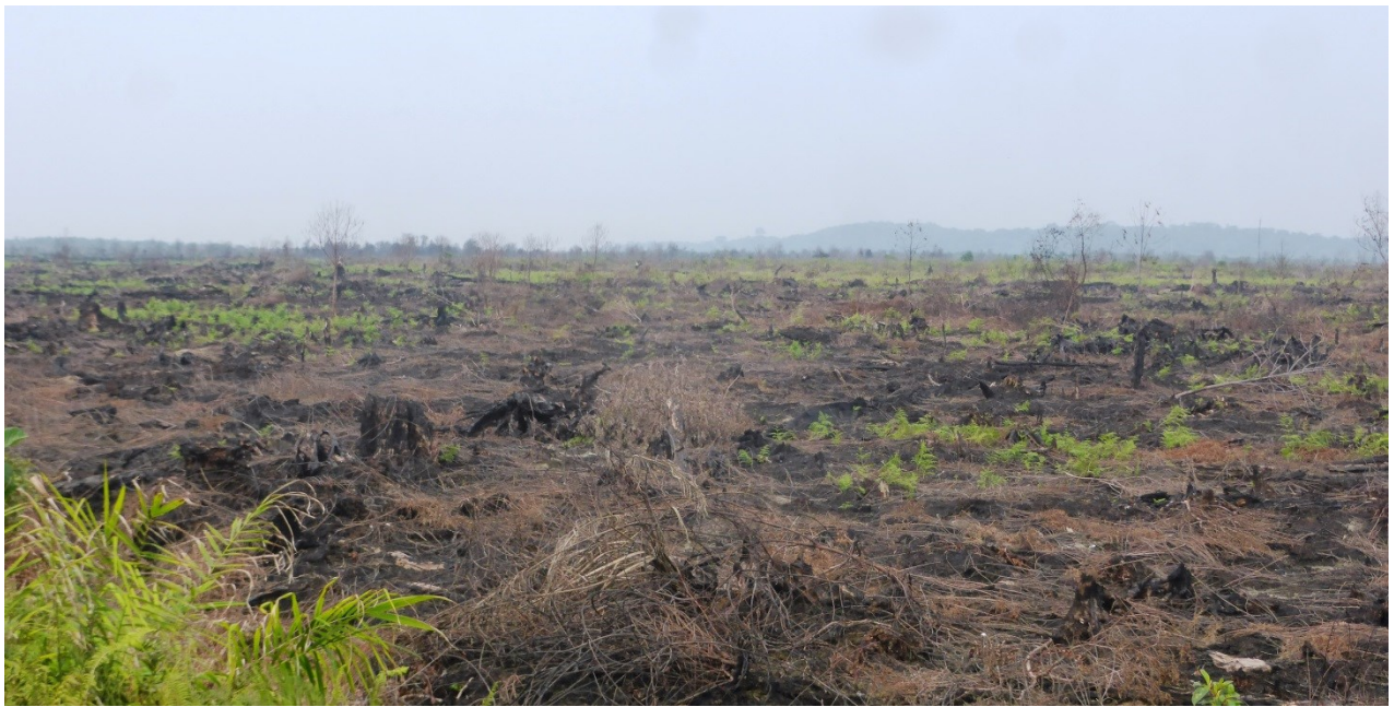
Gambar 1 dan 2. Hamparan Pembakaran hutan dan lahan di areal konsesi PT Ruas Utama Jaya, luas pembakaran mencapai ratusan hektar dan diperkirakan terjadi pada Juli 2015. Gambar diambil pada titik koordinat N 0°7'53.33"N E 101°52'29.20" (gambar 1) dan N1°48'47.29" E101°5'0.54" (gambar 2). Gambar diambil pada tanggal 30 Agustus 2015. Eyes on the Forest 2015.