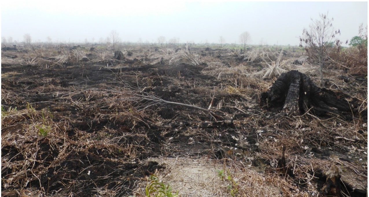
Gambar 3 dan 4. Hamparan Pembakaran hutan dan lahan di areal konsesi PT Ruas Utama Jaya, luas pembakaran mencapai ratusan hektar dan diperkirakan terjadi pada Juli 2015. Gambar diambil pada titik koordinat N1°49'26.13" E101°4'59.26" (gambar 3) N1°48'47.06" E101°5'0.57" (gambar 4). Gambar diambil pada tanggal 30 Agustus 2015.