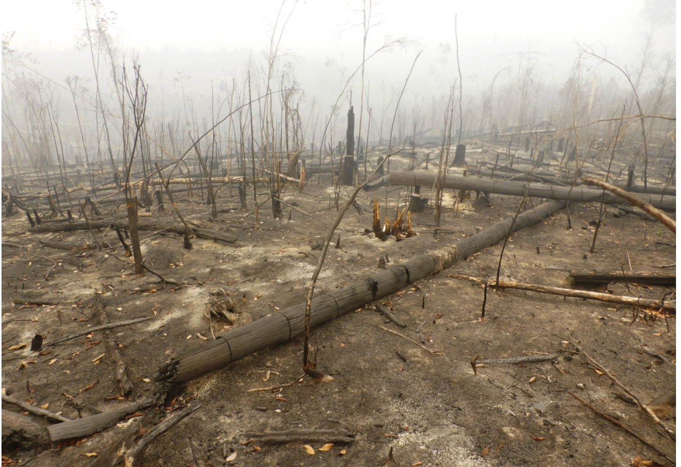
Gambar 3. 4 dan 5. Pembakaran hutan dan lahan di konsesi IUPHHK-HA PT. Hutani Sola Lestari diindikasikan bertujuan untuk pembersihan lahan, Gambar 3 menunjukkan setelah pembakaran dilakukan penebangan dan sebaliknya pada gambar 4 dan 5 penebangan dilakukan sebelum pembakaran. Gambar diambil pada titik koordinat S0^{\circ}1'46.54''