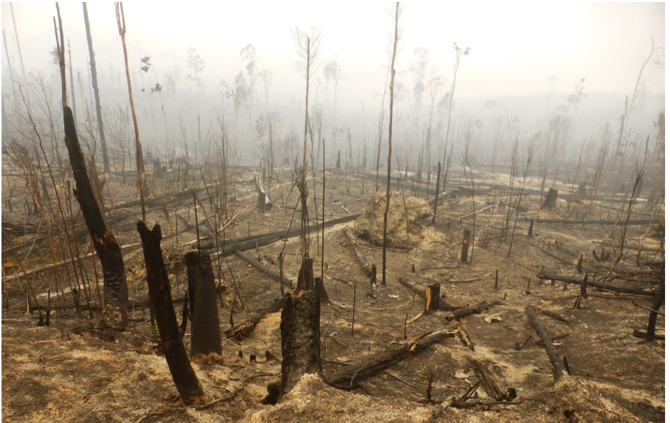
Gambar 1 dan 2. Pembakaran hutan dan lahan sekitar 400 hektar di konsesi IUPHHK-HA PT. Hutani Sola Lestari. Gambar diambil pada titik koordinat S0^{\circ}6'20.30'' E101^{\circ}34'48.80'' (gambar 1) dan S0^{\circ}1'52.63'' E101^{\circ}28'9.54'' (gambar 2). Gambar diambil tanggal 19 Oktober 2015. Eyes on the Forest 2015.