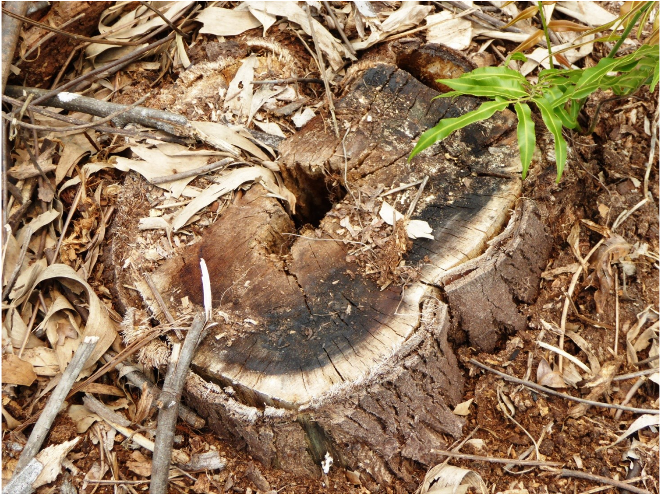
Gambar 1. Tunggul sisa pembakaran pada IUPHHK-HT PT Arara Abadi (Pulau Muda). Luas pembakaran mencapai 50 hektar dan terjadi sekitar Agustus-September 2015. Gambar diambil pada titik koordinat N0°7'31.82" E102°41'3.46" Gambar diambil tanggal 11 Oktober 2015.