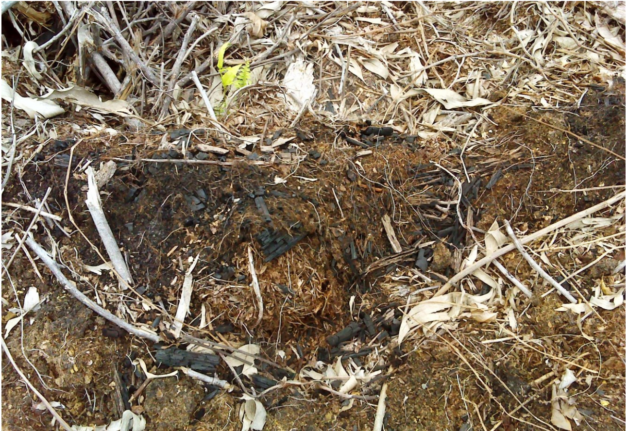
Gambar 2. Sisa pembakaran pada IUPHHK-HT PT Arara Abadi (Pulau Muda). Luas pembakaran mencapai 50 hektar dan terjadi sekitar Agustus-September 2015. Gambar diambil pada titik koordinat N0°7'32.06" E102°41'3.01". Gambar diambil tanggal 11 Oktober 2015.