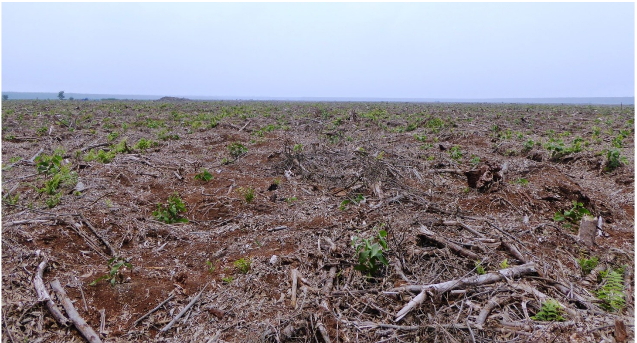
Gambar 3. Areal bekas pembakaran pada IUPHHK-HT PT Arara Abadi (Pulau Muda) telah ditanami akasia kembali. Gambar diambil pada titik koordinat N0°7'19.48" E102°41'3.51". Gambar diambil tanggal 11 Oktober 2015. Eyes on the Forest 2015.