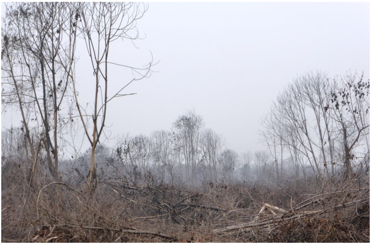
Gambar 1 dan 2. Pembakaran hutan (indikasi kawasan lindung) di areal IUPHHK-HT PT. Arara Abadi (Minas) seluas 200 hektar. Gambar diambil pada titik koordinat N0°41'53.75" E101°14'16.68" (gambar 1) dan N0°41'30.00" E101°14'49.32" (gambar 2). Gambar diambil tanggal 17 Oktober 2015. Eyes on the Forest 2015.