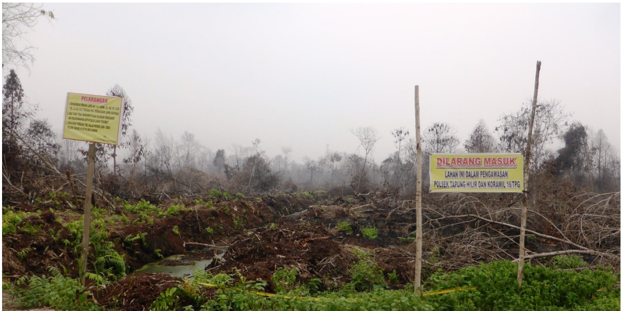
Gambar 3. Pemberitahuan dari Kepolisian bahwa pembakaran hutan (indikasi kawasan lindung) di areal IUPHHK-HT PT. Arara Abadi (Minas) seluas 200 hektar tengah diproses hukum. Gambar diambil pada titik koordinat N0°42'41.74" E101°14'16.86". Gambar diambil tanggal 17 Oktober 2015. Eyes on the Forest 2015.