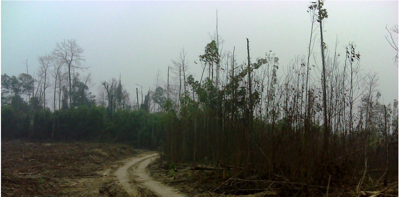
Gambar 2. Pembakaran di IUPHHK-HT PT Arara Abadi (Pelalawan) Luas pembakaran mencapai 200 hektar dan terjadi sekitar September 2015.. Gambar diambil pada titik koordinat N0°12'37.53" E102°14'46.37". Gambar diambil tanggal 13 Oktober 2015. Eyes on the Forest 2015.