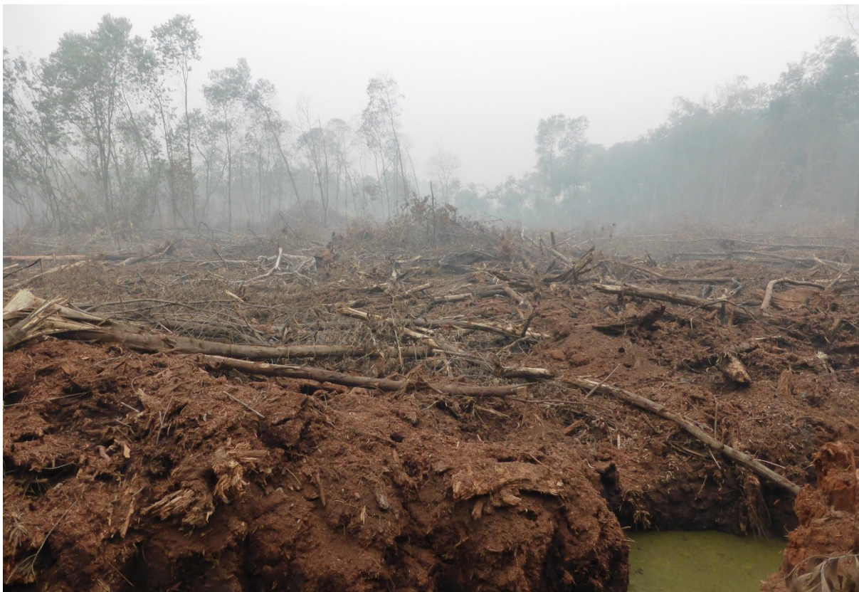
Gambar 1. Pembakaran dengan luas sekitar 2 hektar pada tegakan akasia yang berumur 3-4 tahun di areal IUPHHK-HT/HTI PT. Arara Abadi Sektor Duri, diperkirakan pembakaran pada September 2015. Gambar diambil pada titik koordinat N0°45'57.51" E101°38'18.74". Gambar diambil tanggal 6 Oktober 2015.