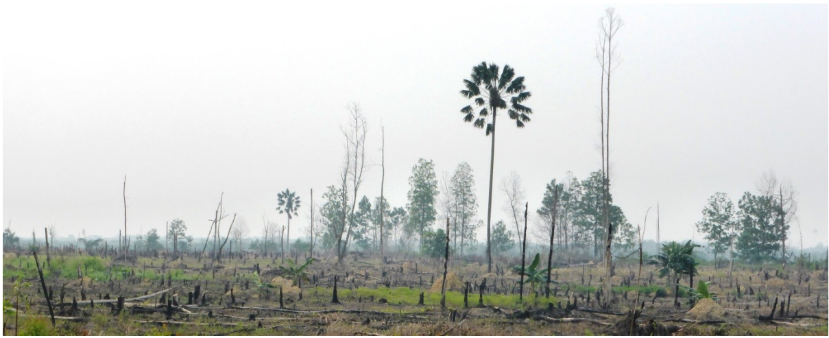
Gambar 2. Pembakaran dengan luas sekitar 50 hektar pada tegakan akasia yang berumur 3-4 tahun di konsesi IUPHHK-HT/HTI PT. Arara Abadi Sector Duri, diperkirakan pembakaran pada Agustus 2015. Gambar diambil pada titik koordinat N0°52'4.40" E101°37'46.50". Gambar diambil tanggal 7 Oktober 2015.