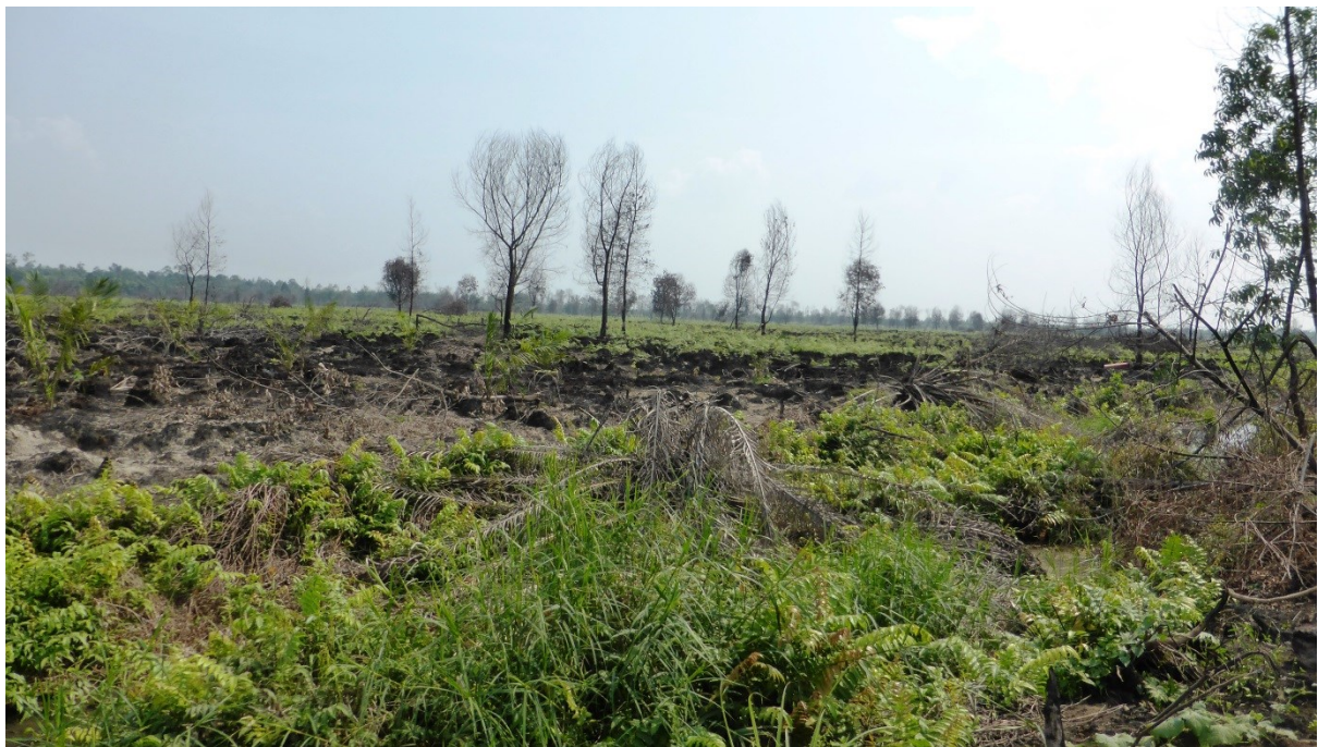
Gambar 1. Pembakaran sekitar 100 hektar pada akasia yang berumur 3-4 tahun di areal IUPHHK-HT/HTI PT. Arara Abadi-Siak, diperkirakan pembakaran pada Agustus 2015. Gambar diambil pada titik koordinat N0°55'21.91" E102°11'6.54". Gambar diambil tanggal 14 Oktober 2015. Eyes on the Forest 2015.