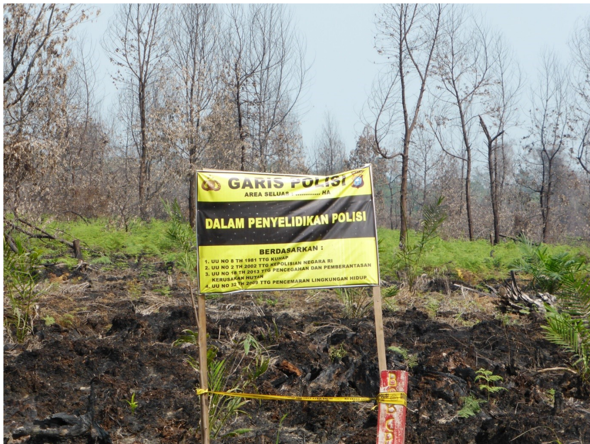
Gambar 2. Pemasangan Police Line oleh Kepolisian yang menunjukan polisi sedang melakukan penyelidikan terhadap pembakaran sekitar 100 hektar pada akasia yang berumur 3-4 tahun di areal IUPHHK-HT/HTI PT. Arara Abadi-Siak. Gambar diambil pada titik koordinat N0°55'21.91" E102°11'6.54". Gambar diambil tanggal 14 Oktober 2015. Eyes on the Forest 2015.