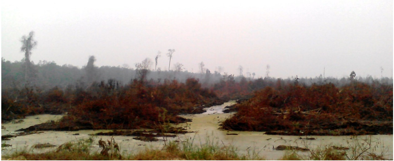
Gambar 2, 3, 4. Pembakaran hutan di Kawasan Lindung PT. Arara Abadi Sei Nilo. Diperkirakan pembakaran hutan di Kawasan Lindung mencapai 50 hektar. Gambar diambil pada titik koordinat S0^{\circ}0'31.31'' E101^{\circ}56'39.29'' (gambar 2) dan S0^{\circ}0'31.29'' E101^{\circ}56'39.31'' (gambar 3 dan 4) . Gambar diambil tanggal 10 Oktober 2015.